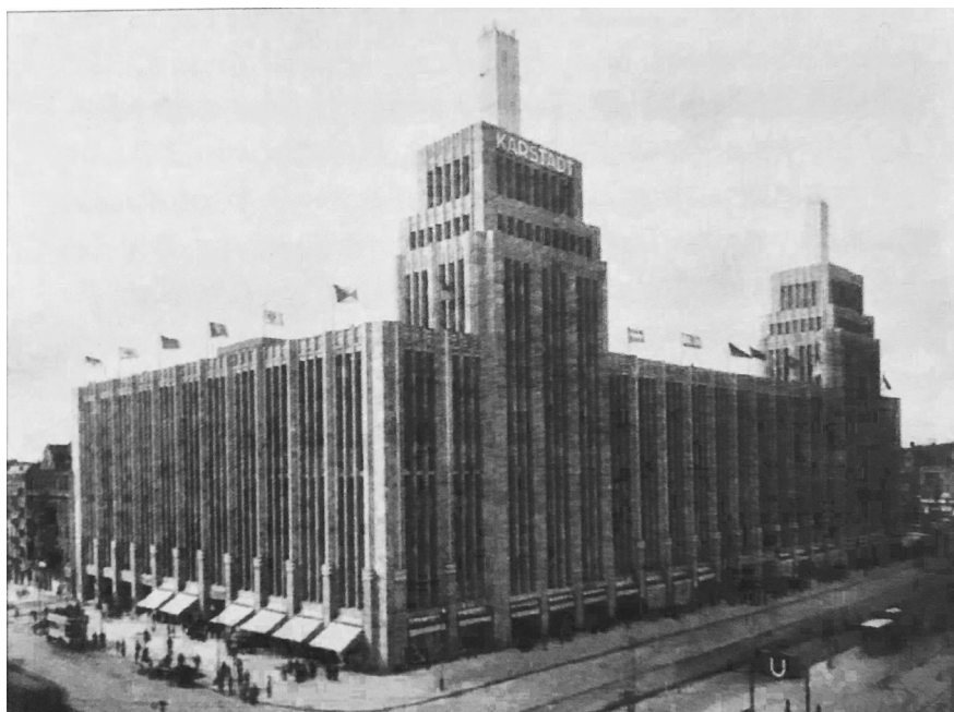
το εμπορικό κέντρο "Karstadt", Hermannplatz, 1930