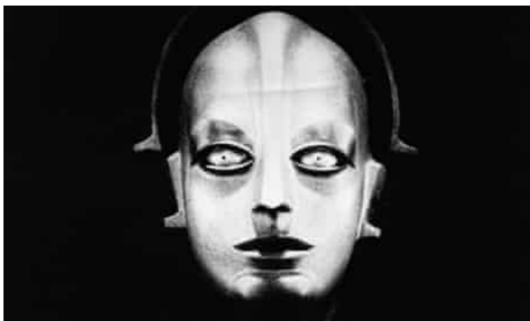
στιγμιότυπο από την ταινία Metropolis , Fritz Lang