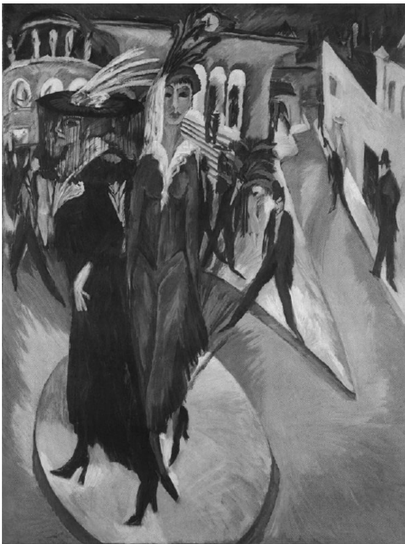
Ernst Ludwig Kirchner- Potsdamer Platz