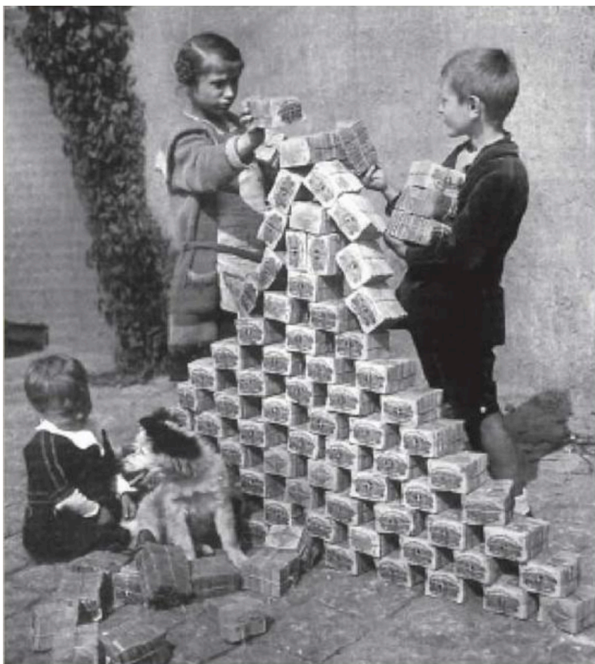
παιδιά παίζουν με πάκους χρημάτων σε περίοδο πληθωρισμού, Βερολίνο 1924