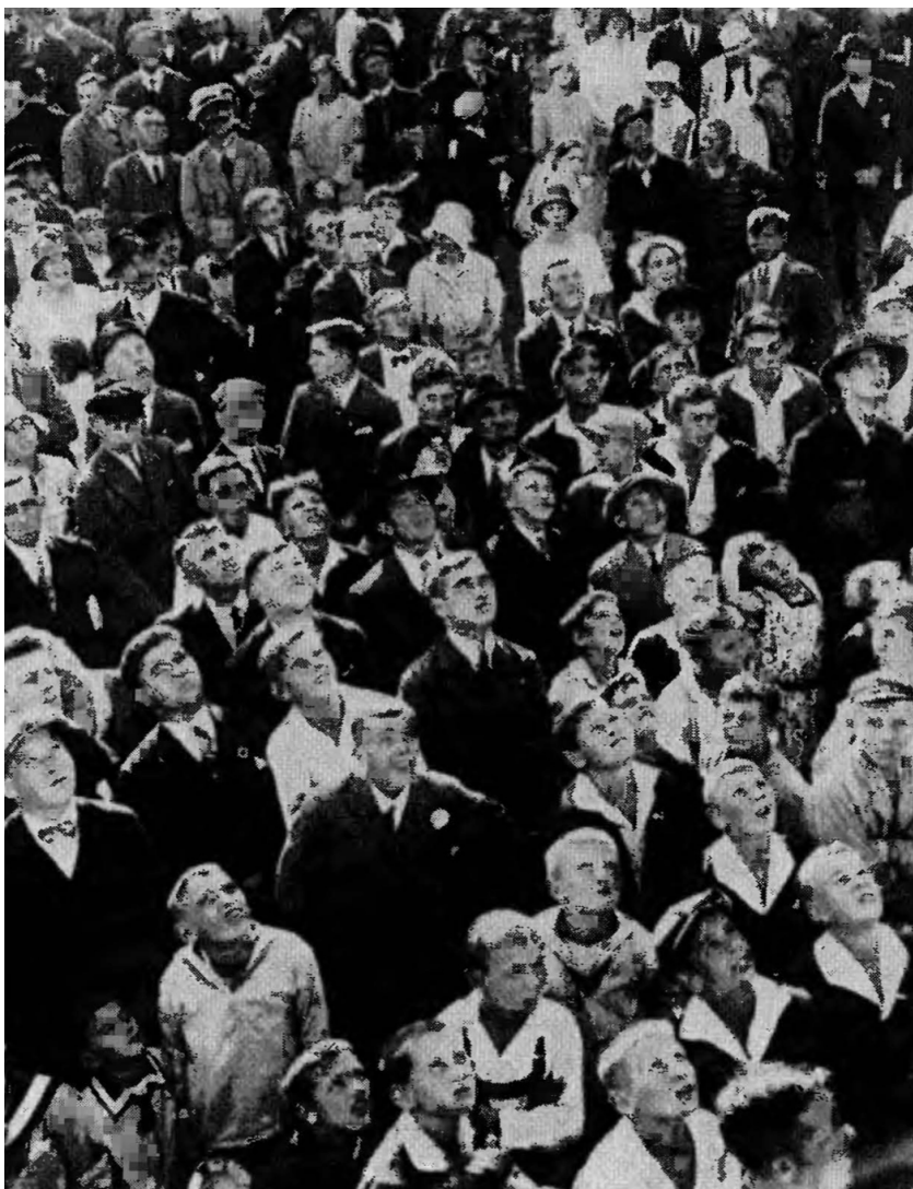
Martin Munkasci, "Θεατές σε αθλητικό αγώνα", π.1933