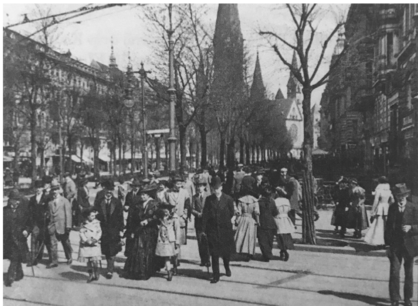
στην αρτηρία Κουρφύρστερνταμ