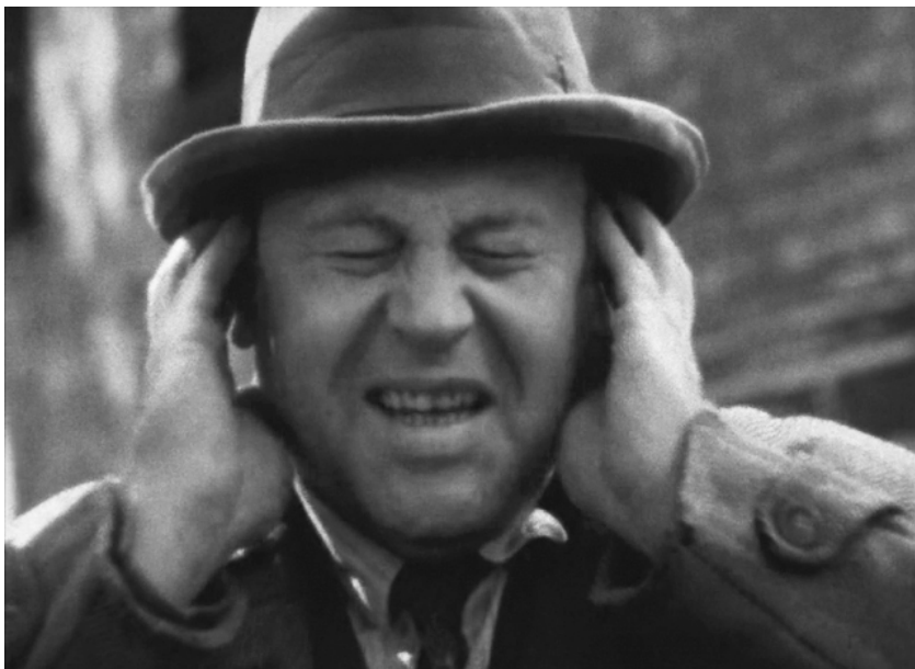
στιγμιότυπο από την ταινία Berlin Alexanderplatz , Fassbinder Rainer Werner