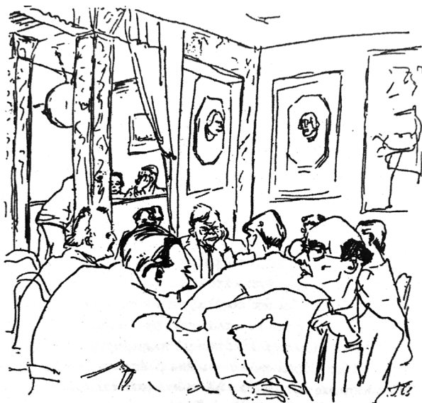
στο καφενείο “Σβάννεκε”, το στέκι των Βερολινέζων καλλιτεχνών και διανοούμενων