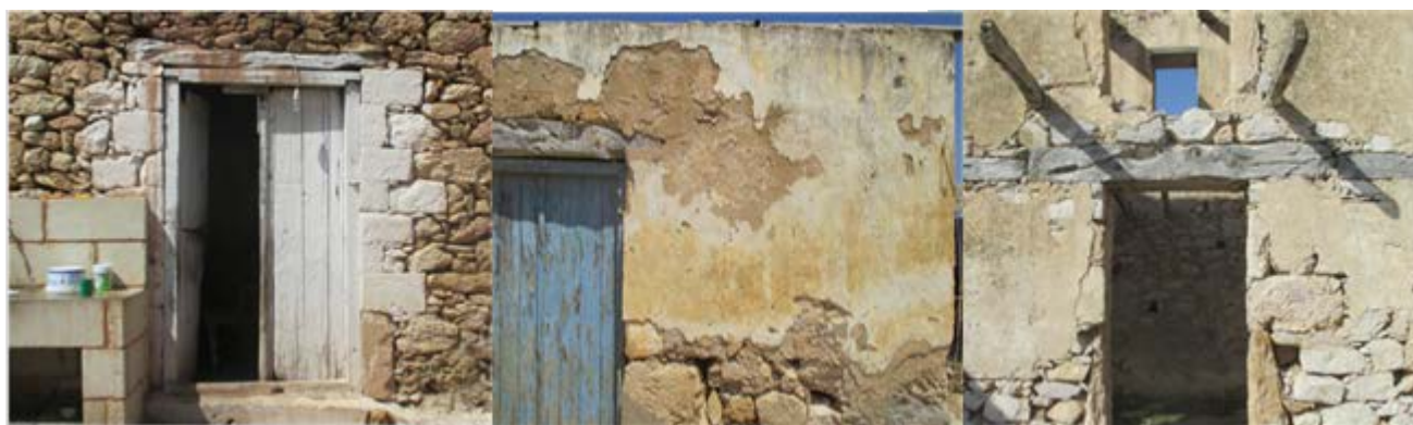
Illustration 12: 39-44 Claire Oiry, "to spiti tou pappou", juin 2016

Στη Γαύδο υπάρχουν πολλές περιπτώσεις ατόμων που έχουν επισκεφθεί το νησί και λόγω του φυσικού κάλλους και της ηρεμίας που εκπέμπει το μέρος έχουν εγκατασταθεί μόνιμα εκεί ή μένουν για μερικούς μήνες. Έχουν επιλέξει λοιπόν να μένουν είτε σε έναν από τους επτά οικισμούς που υφίστανται σήμερα στο νησί, είτε σε δασικές περιοχές κοντά στις ακτές. Παρόλα αυτά, δεν έχει δημιουργηθεί κάποιου είδους οργανωμένης κοινότητας με αποτέλεσμα να προκαλούνται συχνά κοινωνικοπολιτικές διαμάχες. Παρατηρούμε άρα, πως δεν έχει αναπτυχθεί στη Γαύδο ο οικοτουρισμός, ενώ είναι ένας μέρος αρκετά ευνοημένο από φυσική ομορφιά και έχει υποστεί ως τώρα ήπιες μορφές ανάπτυξης. Δεν θα ταίριαζε άλλωστε και σύμφωνα με τη φέρουσα ικανότητα του νησιού κάποια εγκατάσταση μεγάλης κλίμακας.