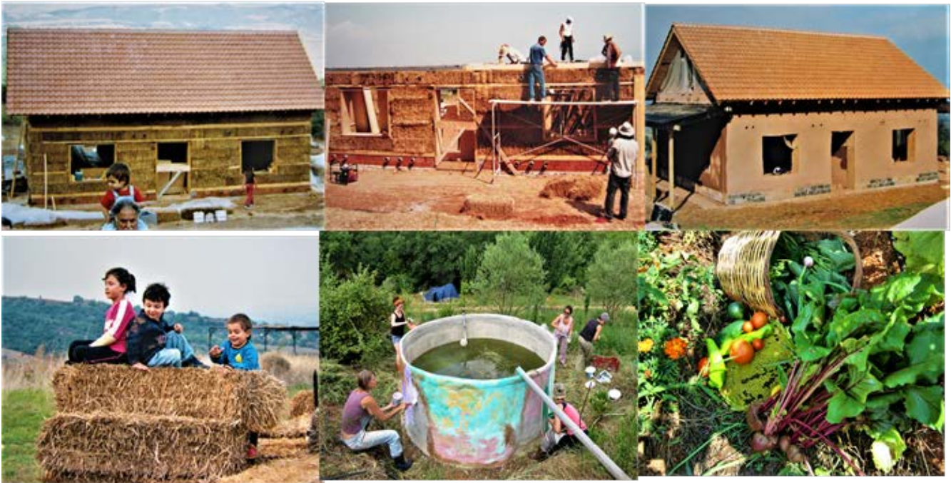
Illustration 6 εικ. 16-21 Ποιοι είμαστε, Οικοχωριό Σκάλα

Οικοχωριό Σκάλα , βρίσκεται στα ΝΑ του Νομού Θεσσαλονίκης, κοντά στο φαράγγι της Σκάλας, σε προστατευόμενη περιοχή υψηλής φυσικής αξίας, ίδρυση 2004.