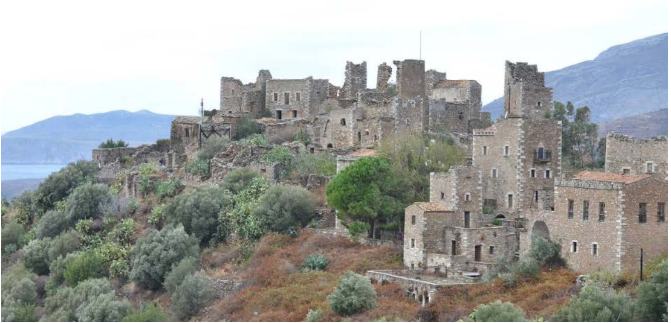
1illustration 5 Καρδαμύλη, Μεσσηνιακή Μάνη - αθηνόγραμμα travel

Τα κτίσματα αυτά χαρακτηρίζονται ως ιδιαίτερου τύπου κοινωνικής οργάνωσης, απτά ίχνη σκληρής ζωής σε άγριο τόπο, αλλά και αποτυπώματα ενός βίαιου τρόπου επιβίωσης. (Γιώργος Πίπτας)