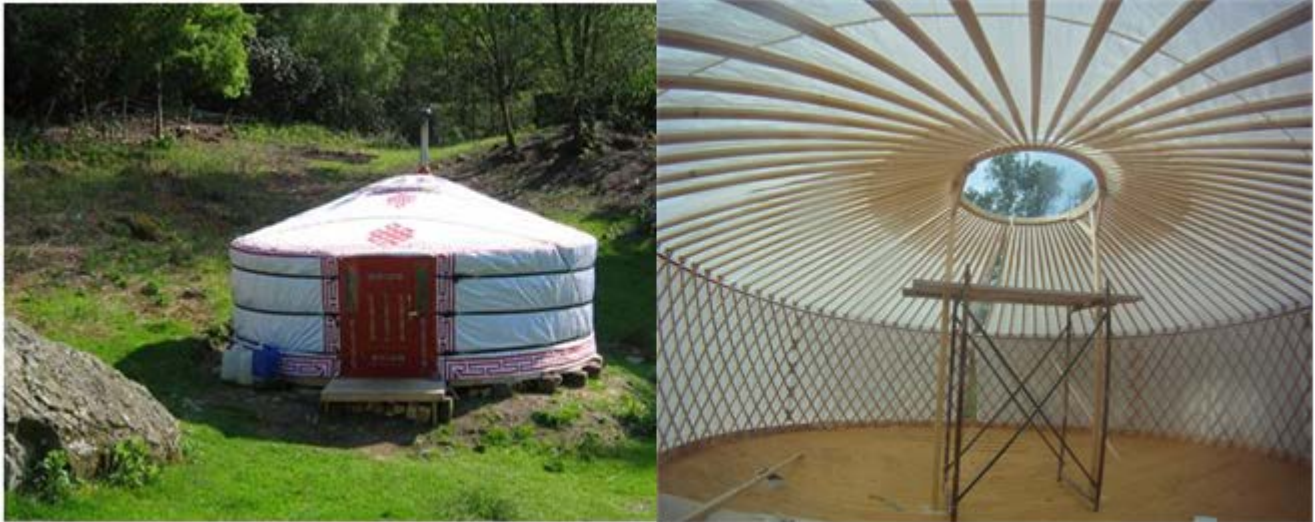
Illustration 9: εικ. 22-29 The Telaithrion Project | a Free and Real Design