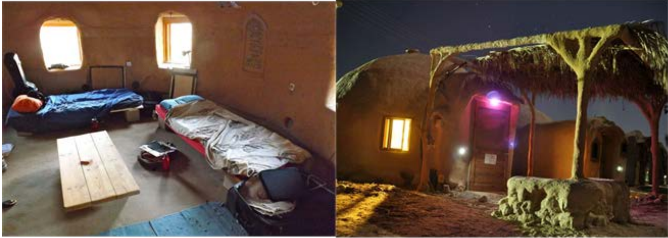
Illustration 9: 30-38 Kibbutz Lotan - Center for Creative Ecology

Το Κέντρο δημιουργικής οικολογίας (CfCE, Center of Creative Ecology), το οποίο ιδρύθηκε το 1997, αναπτύχθηκε από την αυξανόμενη επιθυμία του Kibbutz Lotan να μειώσει τις περιβαλλοντικές επιπτώσεις και να υιοθετήσει έναν πιο βιώσιμο τρόπο ζωής. Εστιάζει: