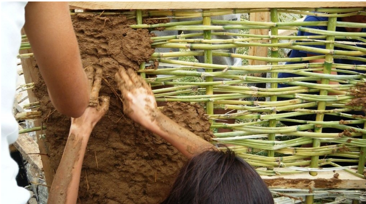
Illustration 11: εικ 73-77 Φυσική δόμηση Βιοκλιματική αρχιτεκτονική Cob.gr, 2020