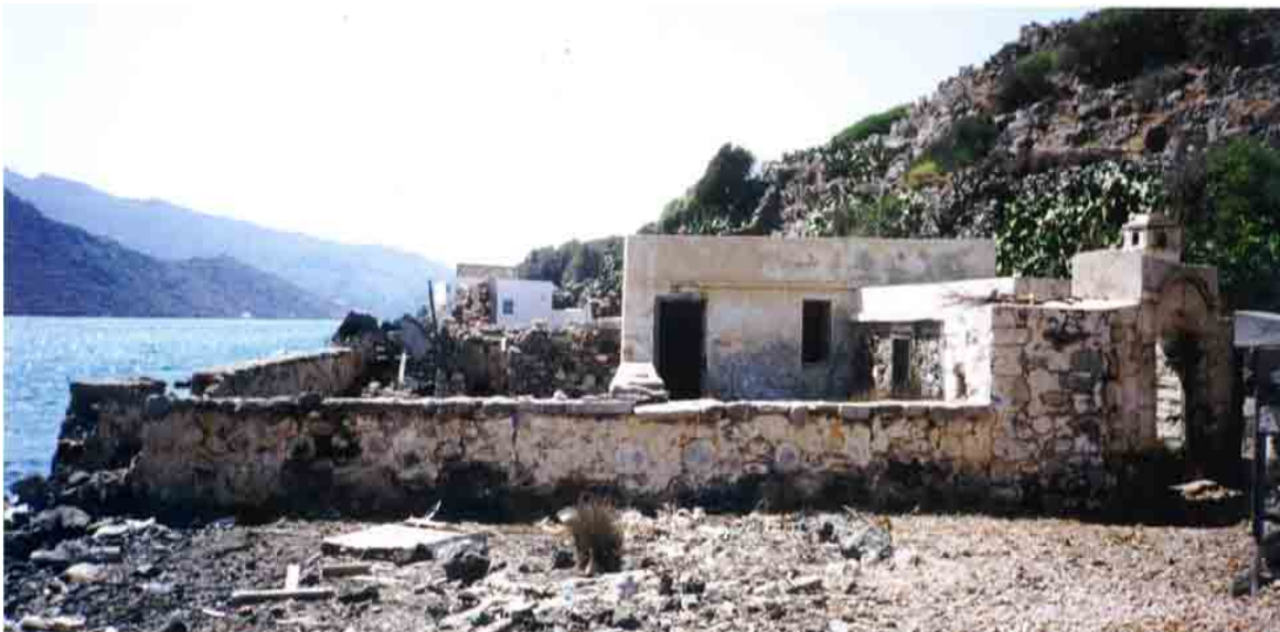
Illustration 2: https://www.humanstories.gr/mia-iliachtida-enallaktikou-tourismou-fotizi-to-tristomo-karpathou/