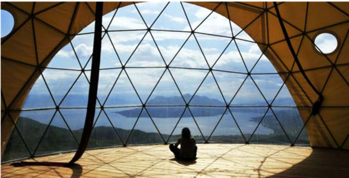
Illustration 8: εικ. 22-29 The Telaithrion Project | a Free and Real Design