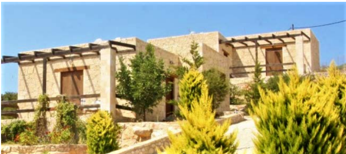
Illustration 7: 51-53 εικ. Ενοικιαζόμενα δωμάτια, Γαύδος https://www.booking.com/region/gr/gavdos.el.html

Όπως έχουμε ήδη αναφέρει, οι κατοικίες της Γαύδου έχουν μικρή κλίμακα και αποτελούνται συνήθως από κουζίνα, καθιστικό και ένα ή δύο υπνοδωμάτια, ενώ το μπάνιο βρίσκεται σε εξωτερικό χώρο. Παρατηρούμε στη συνέχεια, πως την ίδια κλίμακα ακολουθούν και τα τουριστικά καταλύματα του νησιού, τα οποία ανήκουν στους μόνιμους κάτοικους, είναι δίκλινα ως επί το πλείστον και αποτελούνται από μικρή κουζίνα, εσωτερικό μπάνιο και υπνοδωμάτιο.