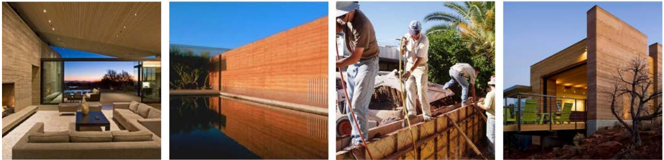
Illustration 10: Φυσική δόμηση Βιοκλιματική αρχιτεκτονική Cob.gr, 2020

Για την τεχνική αυτή συμπιέζουμε σε καλούπια αργιλώδες χώμα ελαφρώς υγρό, ως που να γίνει απόλυτα συμπαγές, παράγοντας κάθετες και επίπεδες επιφάνειες.