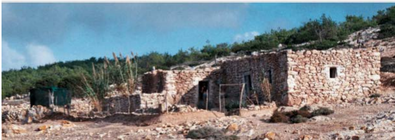
Illustration 5: 39-44 Claire Oiry, “to spiti tou pappou”, juin 2016