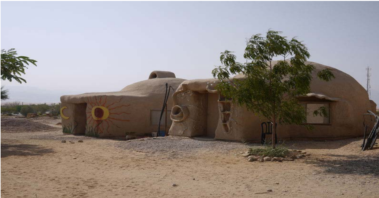
Illustration 4: 30-38 Kibbutz Lotan - Center for Creative Ecology

Το Kibbutz Lotan, (Kibbutz: κοινότητα με συλλογική ιδιοκτησία). Σαν κοινότητα δημιουργήθηκε το 1983 στο νότιο τμήμα της ερήμου Arava, 55 χιλιόμετρα βόρεια της πόλης Eilat. Πιο συγκεκριμένα,