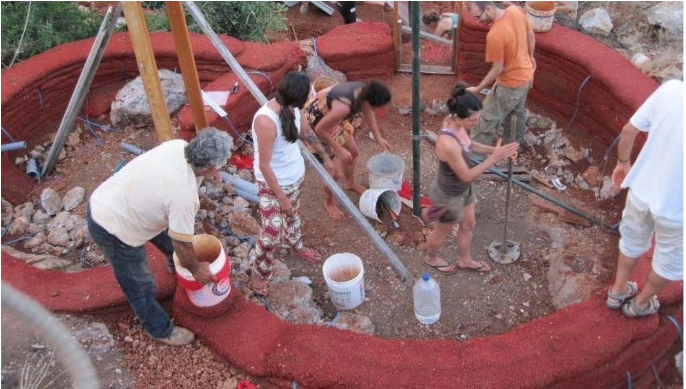
Illustration 9: εικ. 60-68 Φυσική δόμηση Βιοκλιματική αρχιτεκτονική Cob.gr, 2020