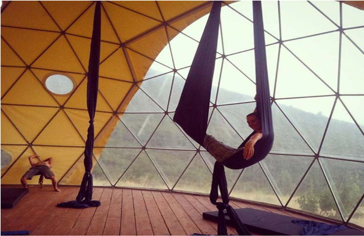
Illustration 7: εικ. 22-29 The Telaithrion Project | a Free and Real Design