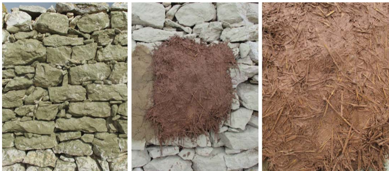
Illustration 12: 45-50 Claire Oiry, "to spiti tou pappou", juin 2016

Στη Γαύδο υπάρχουν πολλές περιπτώσεις ατόμων που έχουν επισκεφθεί το νησί και λόγω του φυσικού κάλλους και της ηρεμίας που εκπέμπει το μέρος έχουν εγκατασταθεί μόνιμα εκεί ή μένουν για μερικούς μήνες. Έχουν επιλέξει λοιπόν να μένουν είτε σε έναν από τους επτά οικισμούς που υφίστανται σήμερα στο νησί, είτε σε δασικές περιοχές κοντά στις ακτές. Παρόλα αυτά, δεν έχει δημιουργηθεί κάποιου είδους οργανωμένης κοινότητας με αποτέλεσμα να προκαλούνται συχνά κοινωνικοπολιτικές διαμάχες. Παρατηρούμε άρα, πως δεν έχει αναπτυχθεί στη Γαύδο ο οικοτουρισμός, ενώ είναι ένας μέρος αρκετά ευνοημένο από φυσική ομορφιά και έχει υποστεί ως τώρα ήπιες μορφές ανάπτυξης. Δεν θα ταίριαζε άλλωστε και σύμφωνα με τη φέρουσα ικανότητα του νησιού κάποια εγκατάσταση μεγάλης κλίμακας.