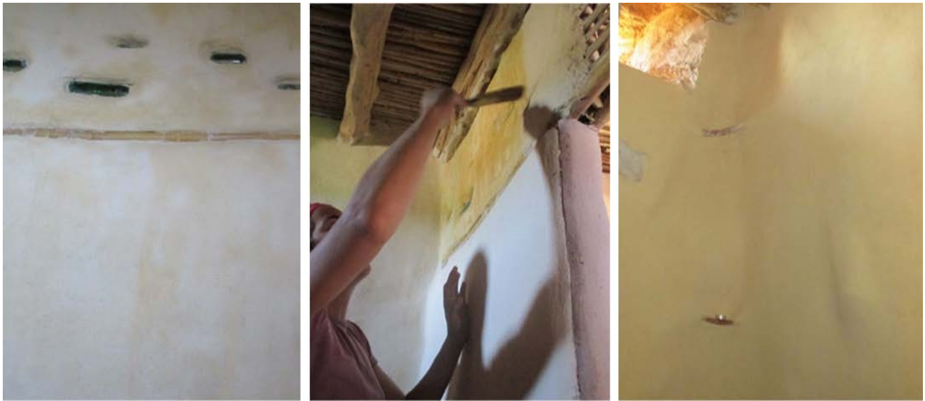
Illustration 6: 45-50 Claire Oiry, “to spiti tou pappou”, juin 2016

Συνεχίζοντας, η Γαύδος είναι ένα μέρος με ήπια οικοδομική ανάπτυξη όπου δεν κατασκευάζονται συχνά νέα κτίσματα, μπορεί όμως τα υφιστάμενα να δέχονται αποκατάσταση ή επέκταση και αυτό γίνεται κατά βάση με υλικά που υπάρχουν στο νησί όπως ξύλο, πέτρα, άργιλο και ακολουθώντας την παραδοσιακή τοπική αρχιτεκτονική, όπως για παράδειγμα τη χρήση των πεύκων ή παλαιά δοκάρια και υποστυλώματα κέδρων που ευδοκιμούν στα δάση. Αυτό βέβαια εμπεριέχει θετικά και αρνητικά στοιχεία, αφού ο κέδρος είναι πολύ σκληρό και ανθεκτικό σαν υλικό (για τη στατικότητα μιας κατασκευής), παρά ταύτα είναι δεδομένο πως αναπτύσσεται σαν είδος πάρα πολύ αργά και έχει τεθεί στα είδη υπό προστασία. Οφείλει λοιπόν, να λαμβάνεται υπόψη η ποσότητα που “αξιοποιείται” σε σχέση με αυτήν που προσπαθεί να αναπτυχθεί. Σχετικά με τον βιοκλιματικό σχεδιασμό και τη φυσική δόμηση δύναται να συναντήσουμε στοιχεία στις κατοικίες του νησιού όπως οι πέτρινοι τοίχοι, τα μικρά ανοίγματα στο βορρά, η κύρια όψη της οικίας που συνήθως είναι τοποθετημένη στο νότο ή την ανατολή, ώστε να αποφεύγονται οι δυνατοί βόρειοι και δυτικοί άνεμοι. Επιπρόσθετα, σχετικά με την κατανάλωση ενέργειας, ένα κοινό στοιχείο που συνήθως απαντάται στις οικίες της Γαύδου είναι ο ηλιακός θερμοσίφωνας, και οι ξυλόσομπες ή εστίες για θέρμανση και παρασκευή φαγητού.