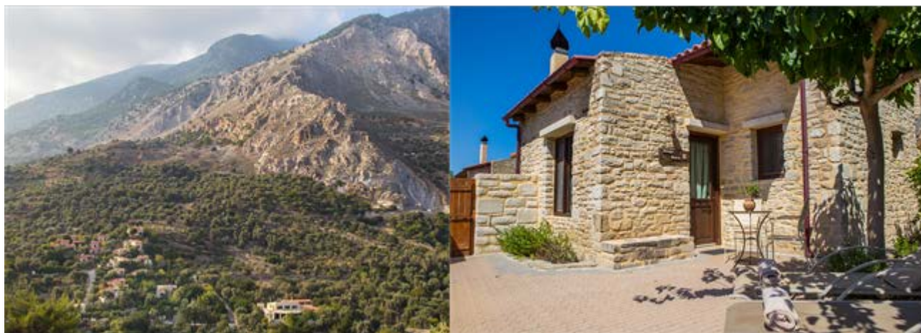
Illustration 4: 6,7,8,9 Παραδοσιακοί ξενώνες Ελαιώνας στον Ζαρό Κρήτης

βιβλίου, ουσιαστική συζήτηση και άλλα που μπορεί να απολαύσει κανείς στον καθαρό αέρα, όντας σε άμεση επαφή με τη φύση.