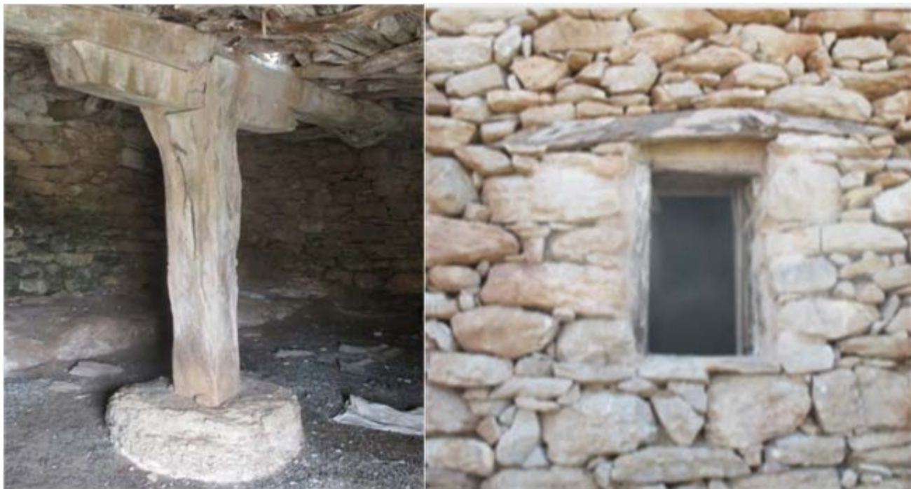
Illustration 12: 39-44 Claire Oiry, “to spiti tou pappou”, juin 2016