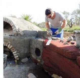
Illustration 17 εικ. 60-68 Φυσική δόμηση Βιοκλιματική αρχιτεκτονική Cob.gr, 2020