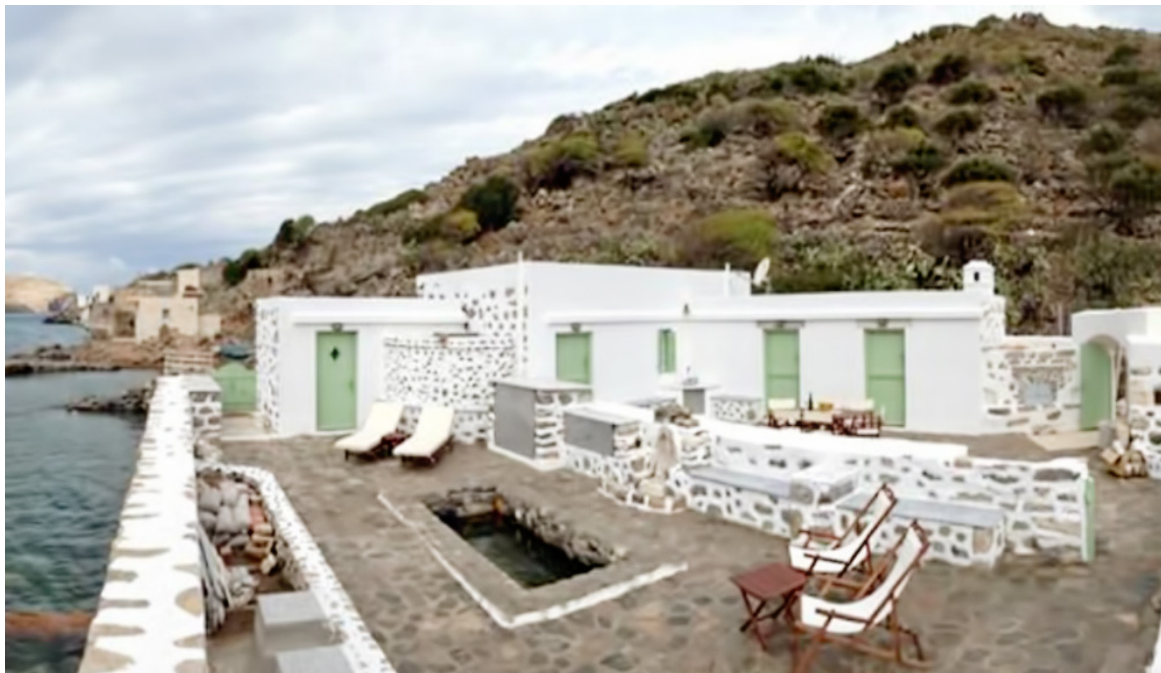
Illustration 3: 3-4-5 Activities – Ilihtida Project, Tristomo, Karpathos. Welcome!