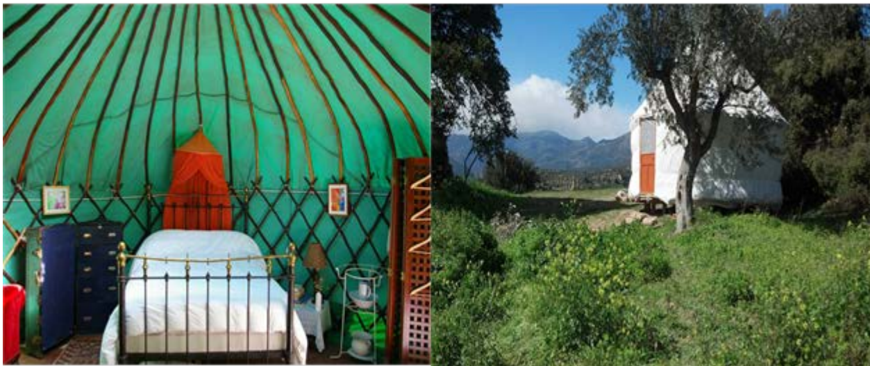
Illustration 10: 30-38 Kibbutz Lotan - Center for Creative Ecology

Το Yurt είναι μια παραδοσιακή σκηνή των νομάδων της Μογγολίας που χρησιμοποιείται εδώ και αιώνες, κατασκευασμένο από ξύλινο σκελετό ή σκελετό από λυγαριά (ένα ελαστικό είδος θάμνου), ντυμένο με μόνωση από μαλλί και εξωτερικό καμβά. Στο σημείο αυτό, οφείλουμε να αναφέρουμε τη σχέση με το φυσικό περιβάλλον, το είδος ευλίγιστου ξύλινου σκελετού που συναντάται στην περιοχή, ως στοιχείο που χρησιμοποιείται για τη βιώσιμη ανάπτυξη, καθώς