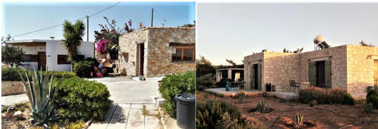
illustration 8: 51-53 εικ. Ενοικιαζόμενα δωμάτια, Γαύδος https://www.booking.com/region/gr/gavdos.el.html

Όπως έχουμε ήδη αναφέρει, οι κατοικίες της Γαύδου έχουν μικρή κλίμακα και αποτελούνται συνήθως από κουζίνα, καθιστικό και ένα ή δύο υπνοδωμάτια, ενώ το μπάνιο βρίσκεται σε εξωτερικό χώρο. Παρατηρούμε στη συνέχεια, πως την ίδια κλίμακα ακολουθούν και τα τουριστικά καταλύματα του νησιού, τα οποία ανήκουν στους μόνιμους κάτοικους, είναι δίκλινα ως επί το πλείστον και αποτελούνται από μικρή κουζίνα, εσωτερικό μπάνιο και υπνοδωμάτιο.