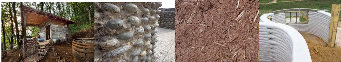
56-59 εικ. Φυσική δόμηση Βιοκλιματική αρχιτεκτονική Cob.gr, 2020