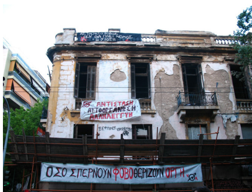
6. όψη της Villa Amalias

θοριστική είναι και η διαχείριση της πρόσβασης. Η πόρτα 81 , η 'κυριολεκτική πύλη- είσοδος' 82 στο εκάστοτε κτίριο, παραβιάζεται κατά τη μαζική είσοδο των καταληψιών 83 . Οι Adilkno σχολιάζουν: 'Η πόρτα ήταν το σημείο διαμέσου του οποίου διέσχιζες το σύνορο προς τον άλλο κόσμο. Η βία απέναντι στην πόρτα ήταν η παραβίαση του νόμου, ο οποίος προσέδιδε στη ζωή τη σταθερή, στεγανή της διάσταση. Η πρωτογενής βία οφειλόταν στο γεγονός ότι η πόρτα έπαυε ξαφνικά να είναι μία συμβολική διάκριση, αλλά κατέληγε ένα μόνο συγκεκριμένο αντικείμενο. Η καθημερινή πραγματικότητα και η άλλη πραγματικότητα αγ-