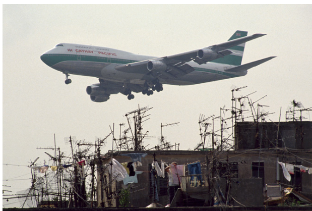
4. κάψουλα μετακίνησης: θύλακος, μη- τόπος, ετεροτοπία