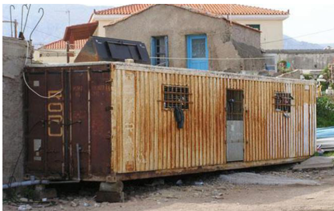
5. λυόμενο του σεισμού του 1999 στην Πάρνηθα φιλοξενεί ακόμη κατοίκους της Αττικής

χωροχρόνος της νόμιμης εξαίρεσης που προασπίζεται τη νομιμότητα και την ‘κανονικότητα’, με τις ευλογίες της αστικής διακυβέρνησης και το διαφοροποιητικό ‘έξω’ να την ‘επικαιροποιεί’ και επιβεβαιώνει.