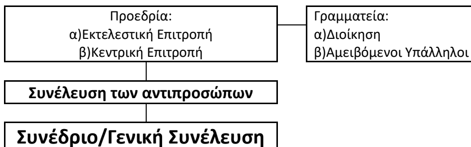
Εικόνα 1Επίσημη δομή μιας ομάδας συμφερόντων 2