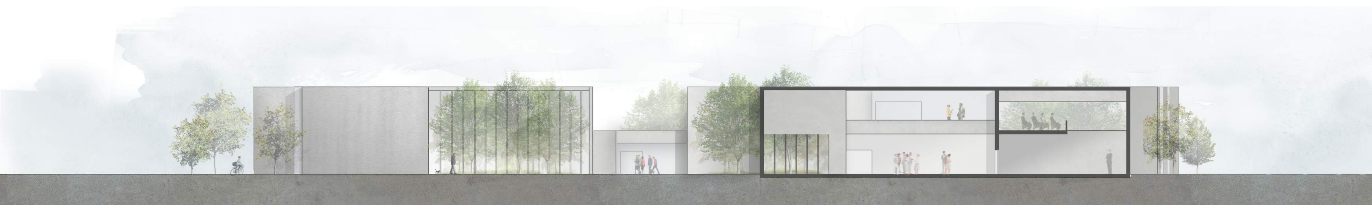
ΟΡΙΖΟΝΤΙΑ ΤΟΜΗ Β