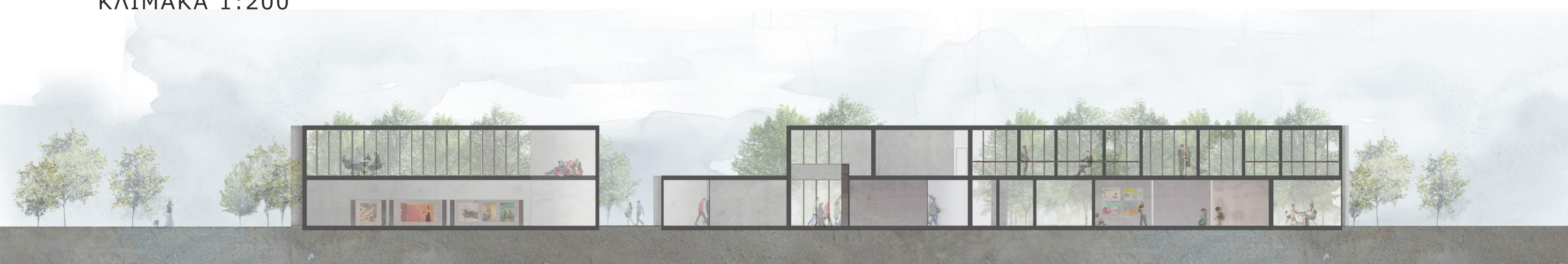
ΟΡΙΖΟΝΤΙΑ ΤΟΜΗ Α